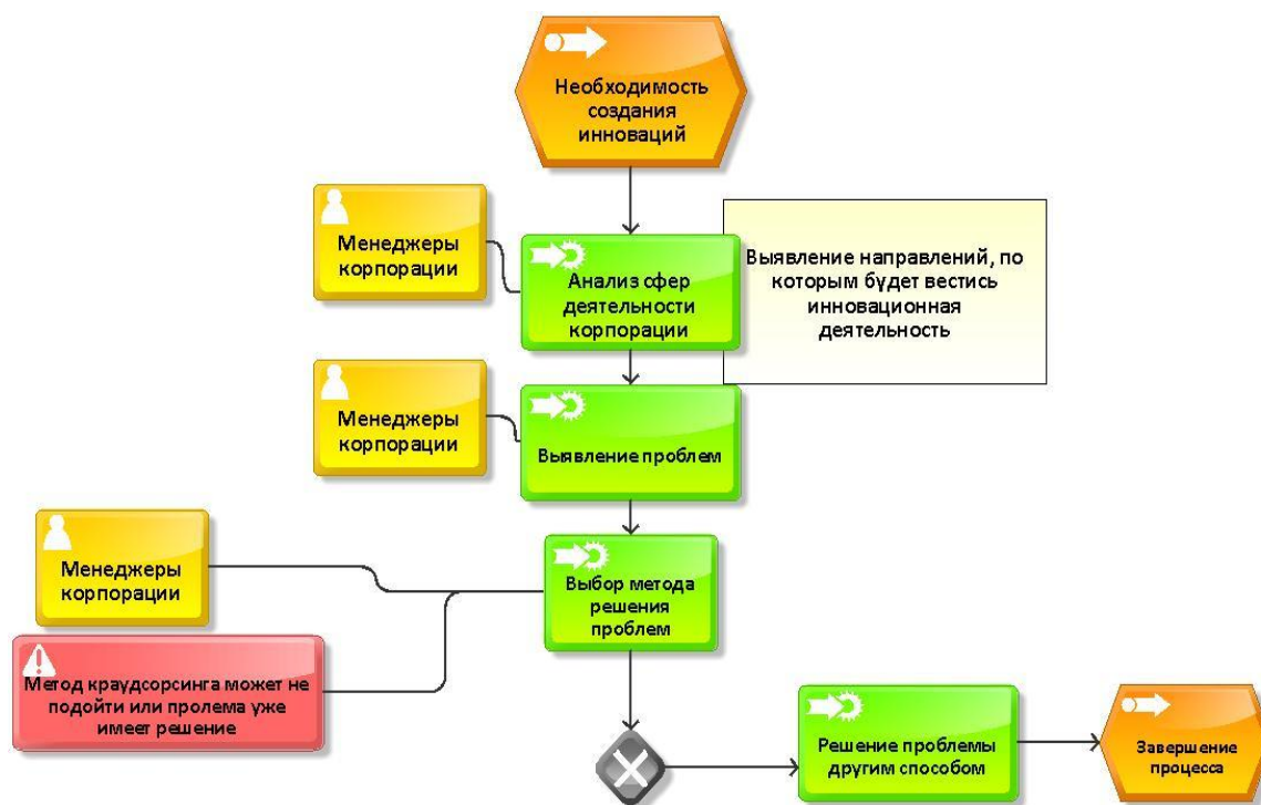
Рис. 2. Модель бизнес-Процесса «Определение отстающих сфер деятельности корпорации и их проблем»

Модель этого бизнес-процесса, выполненная с помощью методологии ARIS, представлена на рис. 2.