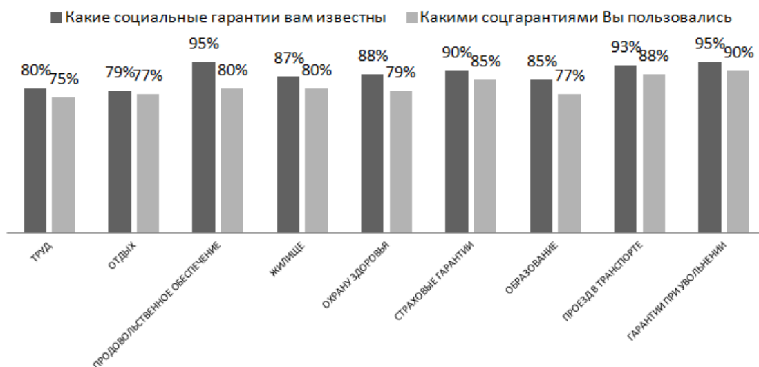
Рис. 3. График 1. Востребованность конкретных социальных прав.