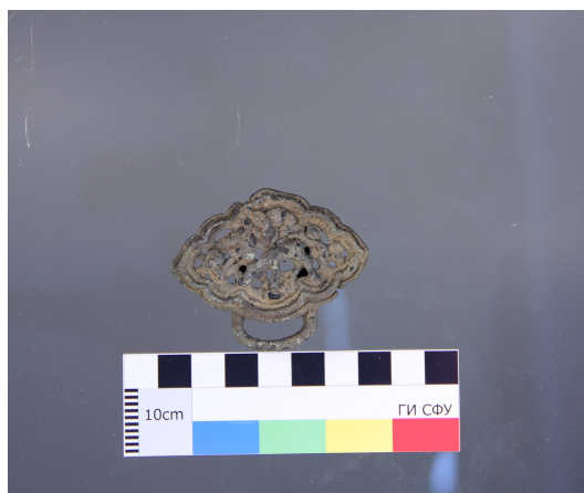
Рис. 1: Находка Богучанской экспедиции – бронзовая обойма