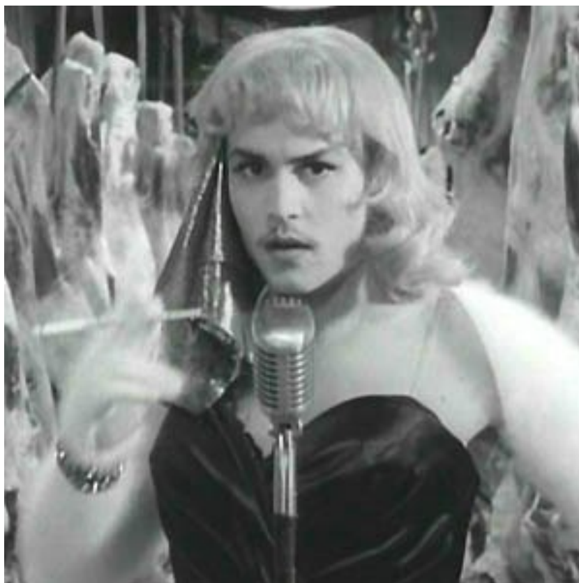
Рис. 4: Джонни Депп в роли эксцентричного режиссера Эдда Вуда