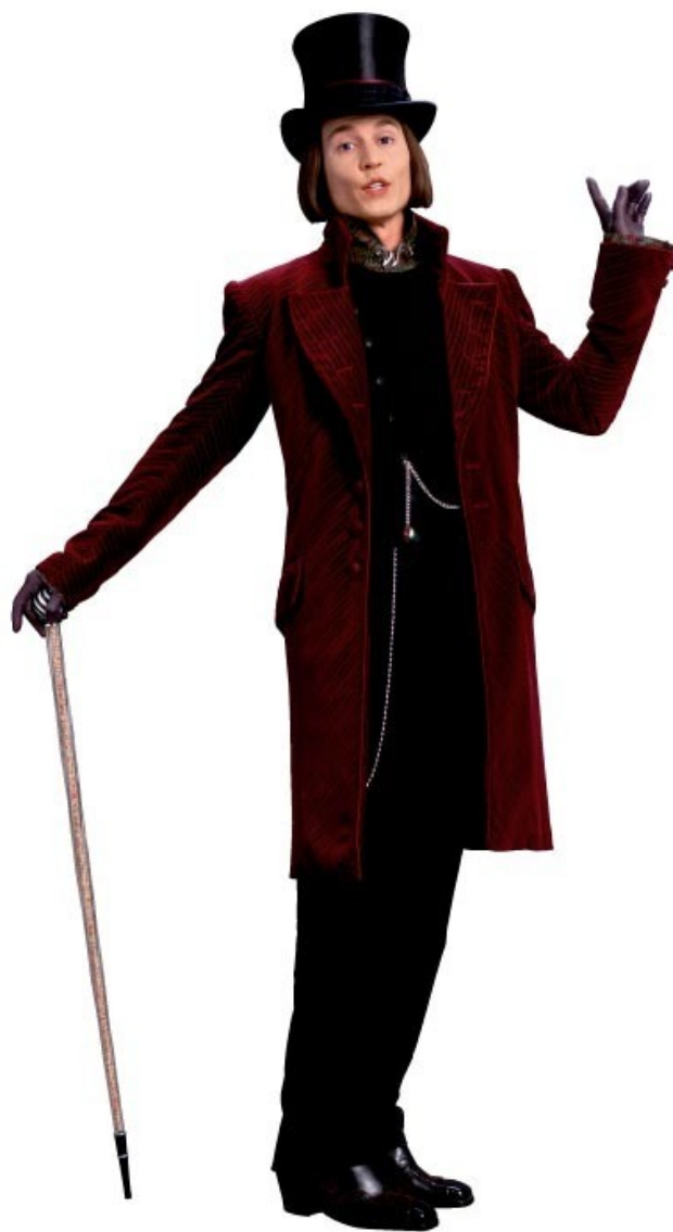
Рис. 3: Джонни Депп в образе Вили Вонки («Чарли и шоколадная фабрика»)