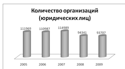
Рис. 2: Диаграмма 1. Количество организаций (юридических лиц) с 2005 по 2009 гг., ед.