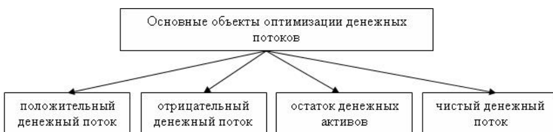
Рис. 1: Основные объекты оптимизации денежных потоков