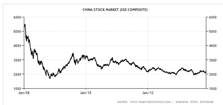
Рис. 2: Динамика Шанхайского композитного индекса за последние 5 лет