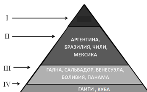
Рис. 1: Соотношение стран латиноамериканского региона